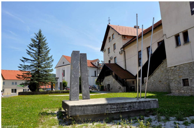
Slika 3: Spomenik v Mokronogu

(vir: https://kraji.eu/slovenija/mokronog/slo , 25. 4. 2025)