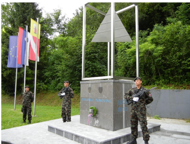
Slika 2: Spominski park v Pogancih