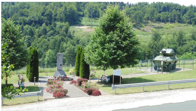
Slika 1: Spominsko obeležje na Medvedjeku